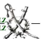
Neuner Oberstleutnant d.R.

und verbleibe mit kameradschaftlichen Grüßen, Ihr und Euer